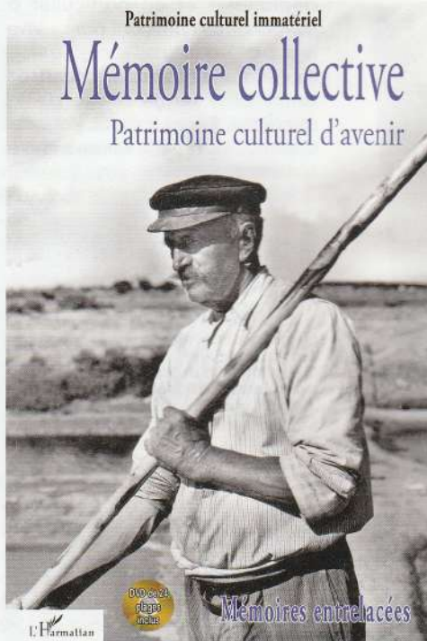
"Mémoire collective : patrimoine culturel d'avenir" : onzième volume de la collection (paru en septembre 2016).

Par Michel Colleu Contact page 113.