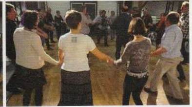
Grand'danse au bal du Vasais le 12 décembre 2015, à Saint-Jean-de-Monts, Vendée.

7 • La Chapelle-sur-Erdre, 2015 (enq. pour la Fédération internationale des trompes de France). Les sonneurs de trompe du groupe Le Bien Allé, de Nantes, chantent une version de L'enfant sans souci lors de la pose durant la répétition, en utilisant d'instinct leur tradition polyphonique de trompe.